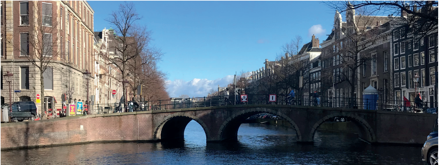
Blick auf eine Gracht

Die Erfahrung in Amsterdam kann ich als äußerst lehrreich beschreiben. Da ich dort Landschaftsarchitektur im Master studierte und dieser in Praxis und Theorie geteilt wird, ist es nötig sich einen Praktikumsplatz zu suchen. Für mich hieß es, vier Tage in der Woche im Büro zu arbeiten und Montags Abends und den ganzen Freitag Veranstaltungen von der Uni zu haben. Diesem Pensum sollte man sich bewusst sein, bevor man sich für Amsterdam entscheiden sollte. Da die Uni so aufgebaut ist, dass es Creditpoints für die Praxisstunden gibt, ist es nötig während des Studiums zu arbeiten. Zusätzlich zu den Kursen in Amsterdam nahm ich an dem EMiLA Kurs teil, der auch ohne Corona online stattfindet. Dieser erfordert viel Selbstlernen und Struktur. Alles in allem ein taffes Programm, aber gleichzeitig kann man unheimlich aus diesen Monaten schöpfen.