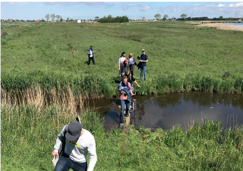
Die Studierenden auf Exkursion

Die Erfahrung in Amsterdam kann ich als äußerst lehrreich beschreiben. Da ich dort Landschaftsarchitektur im Master studierte und dieser in Praxis und Theorie geteilt wird, ist es nötig sich einen Praktikumsplatz zu suchen. Für mich hieß es, vier Tage in der Woche im Büro zu arbeiten und Montags Abends und den ganzen Freitag Veranstaltungen von der Uni zu haben. Diesem Pensum sollte man sich bewusst sein, bevor man sich für Amsterdam entscheiden sollte. Da die Uni so aufgebaut ist, dass es Creditpoints für die Praxisstunden gibt, ist es nötig während des Studiums zu arbeiten. Zusätzlich zu den Kursen in Amsterdam nahm ich an dem EMiLA Kurs teil, der auch ohne Corona online stattfindet. Dieser erfordert viel Selbstlernen und Struktur. Alles in allem ein taffes Programm, aber gleichzeitig kann man unheimlich aus diesen Monaten schöpfen.