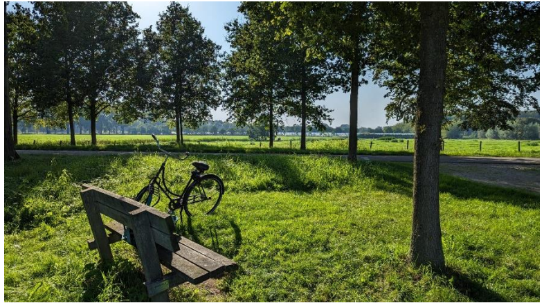
Abb. 2 - Ausflug ins Umland mit dem Rad. Nur 5 min vom Science Park entfernt ist man schon zwischen Kühen und Landhäusern. Wunderschön!

Mein Alltag war meistens von Arbeit für die Uni geprägt. Persönlich hatte ich danach nicht mehr viel Energie groß was zu unternehmen, allerdings betone ich, dass das eine sehr persönliche Erfahrung ist. Die UU bietet zahlreiche Student Associations nach Interessen und/oder Fakultäten, die regelmäßig Events und Ausflüge planen. Hervorzuheben ist auch das BuddyGoDutch-Programm in dem man einen local student als Buddy zugewiesen kriegt. Das Sportcentrum Olympos hat zudem 2 Fitness Studios