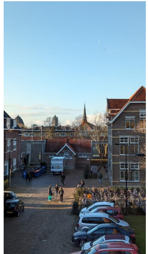
Abb. 1 - Aussicht aus meinem Fenster am Kriekenpitplein

Inhaltlich sind die Kurse auf dem neusten Stand der Dinge und hochaktuelle Themen werden besprochen. Ich schätzte den Wert der auf Sustainability gelegt wurde und wie alle Kurse einen unterschiedlichen Zugang dazu fanden. Oft sind auch Experten und unternehmensnahe Vertreter als Gastvorlesende da und es war stets interessant sich so viele unterschiedliche Perspektiven anzuhören und zu erarbeiten. Ich freute mich auf jede Veranstaltung und war sehr neugierig was denn die Nächste so bringen würde.