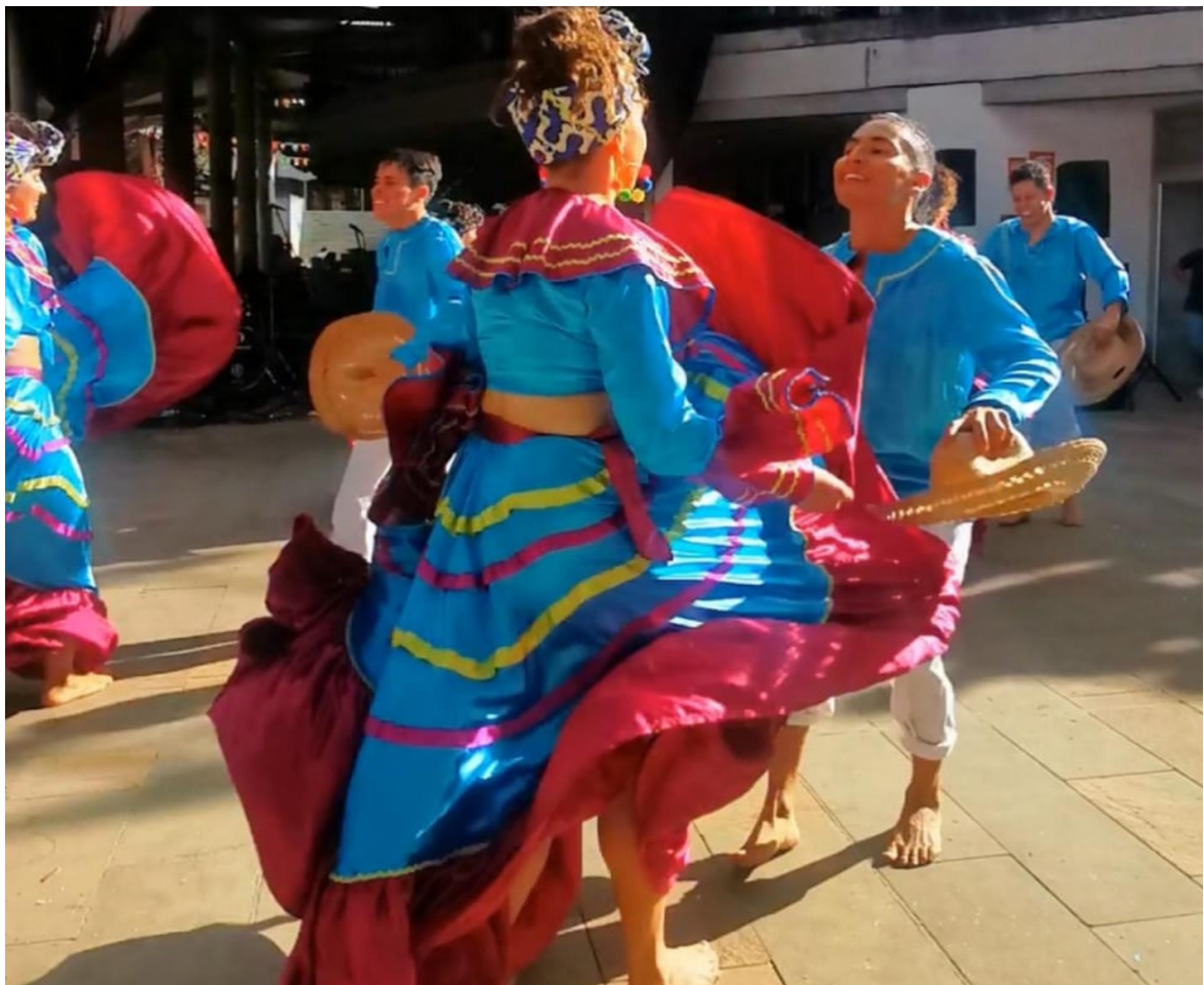
Präsentation folklorischer kolumbianischer Tänze während der semana universitaria