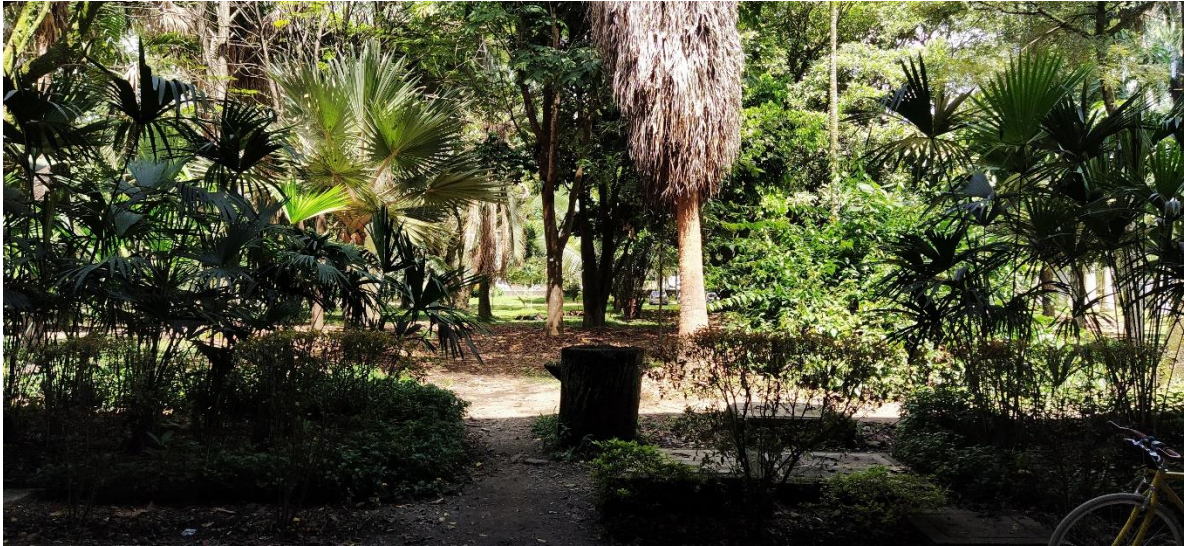
Ausgeprägte Flora auf dem Campus der UNAL sede Medellín