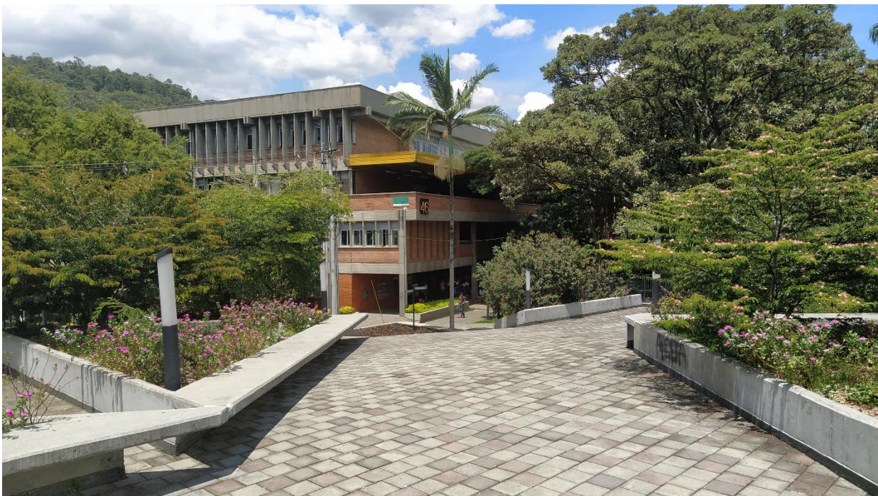
Teil des Campus der UNAL sede Medellín

Ich hoffe dieser Bericht kann helfen, einen kleinen Überblick über das Leben in Medellín zu geben. Das Wichtigste ist sicherlich auf die Paisas zuzugehen und neue Freundschaften zu schließen, offen gegenüber kulturellen Unterschieden zu sein und unvoreingenommen neue Erfahrungen zu sammeln. Sollten allerdings noch Fragen zu bestimmten Themen bestehen, kann mir jeder Interessierte gerne eine E-Mail zukommen lassen an Stephan.hpunkt@gmail.com . Viel Spaß im wunderschönen Kolumbien!