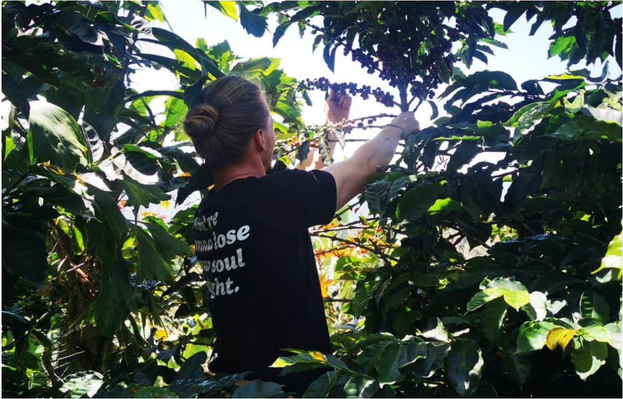
Ich beim Kaffee pflücken