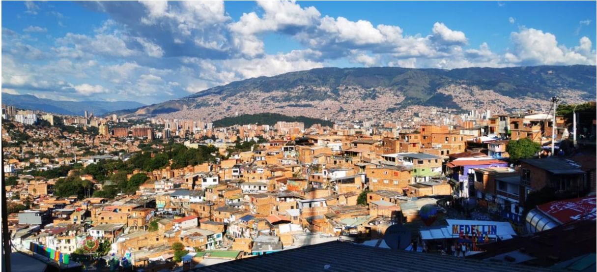
La comuna 13 in Medellín