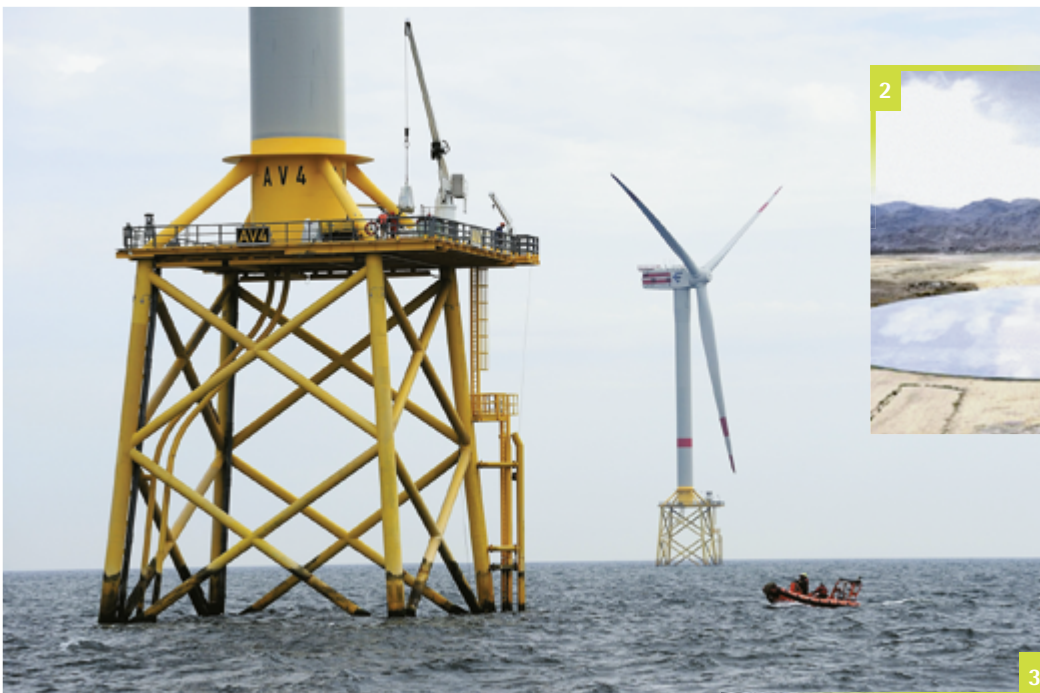
Abbildung 3 Jacket-Konstruktionen als Gründungsstruktur für Offshore-Windenergieanlagen.

klings schon etwas paradox, dass man in der Wüste zunächst eine Eisfabrik bauen muss, bevor man den Spezialbeton herstellen kann. Mitarbeiter am Institut für Baustoffe der Leibniz Universität Hannover forschen an Konzepten zum Entwurf solcher Betone, die speziell für diesen Anwendungsfall geeignet sind und über große Höhen entmischungsfrei gepumpt werden können.