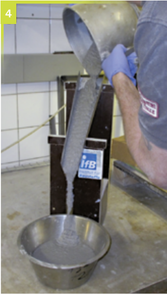
Abbildung 4 Fließfähigkeit verwendeter Vergussbetone