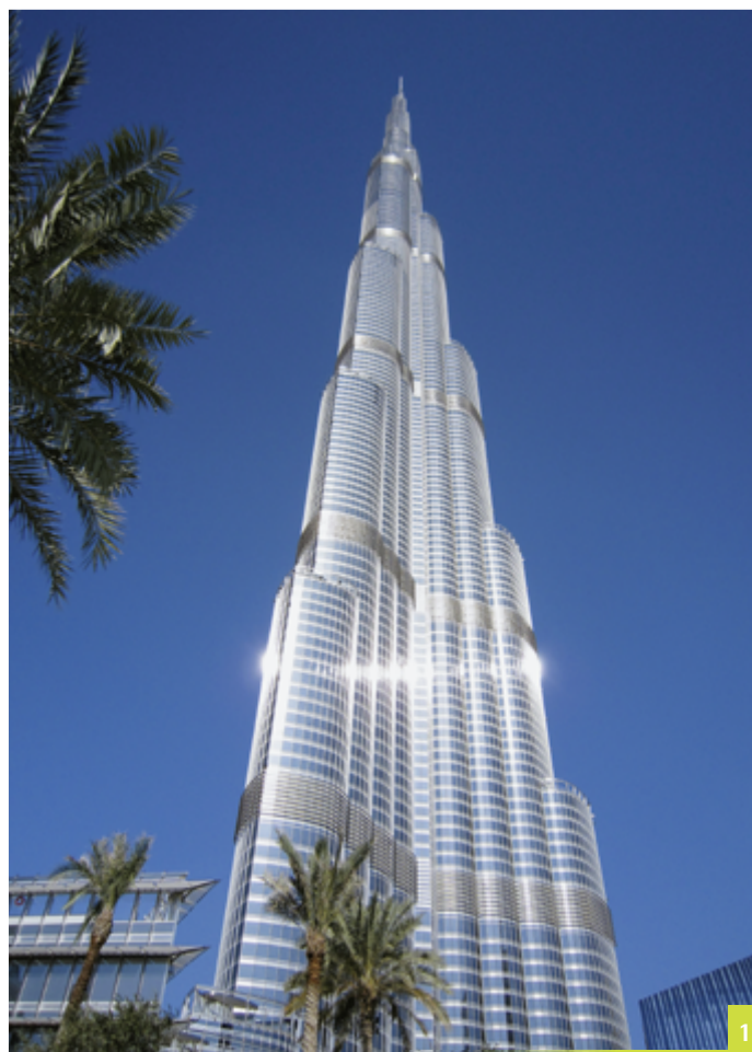
Abbildung 1 Burj Khalifa in Zahlen: Höhe: 828 Meter Stockwerke: 200, 160 nutzbar Geschossfläche: 517.240 m 2 Aufzüge: 57 Gewicht: 500.000 Tonnen Konstruktion: Stahlbeton und Stahl Fassade: Glas und Aluminium Bauzeit: 2004–2010 Arbeitsstunden: 22 Millionen Baukosten: ca. 1 Milliarde Euro Eröffnung: 4. Januar 2010

Beton ist ein sehr alter Baustoff. Der künstlich hergestellte Stein ist ein vergleichsweise günstiges Massenprodukt, das vielfältig eingesetzt wird. Wissenschaftler vom Institut für Baustoffe forschen an Methoden, um Spezialbetone zu entwickeln, die für besondere Bauten wie zum Beispiel extrem hohe Türme oder Windenergieanlagen geeignet sind.