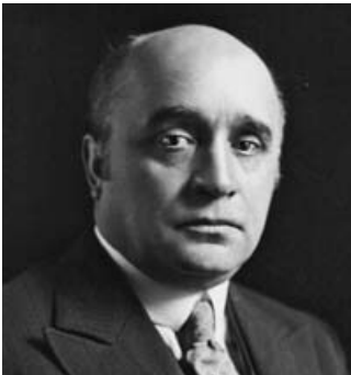
F. Bergius um 1930

Der Nobelpreis ist wohl die höchste Auszeichnung, mit der die Arbeit eines Wissenschaftlers gewürdigt werden kann. Der hoch angesehene und hochdotierte Preis wurde von dem schwedischen Erfinder und Industriellen Alfred Nobel gestiftet und wird seit 1901 jedes Jahr in den Kategorien Physik, Chemie, Medizin, Literatur, Wirtschaftswissenschaften und Friedensbemühungen vergeben. Auch aus den Reihen der Ehemaligen der Leibniz Universität sind Nobelpreisträger hervorgegangen. AlumniCampus stellt einige von ihnen hier vor: Zwei für das Fach Chemie, sowie ein Physiker.