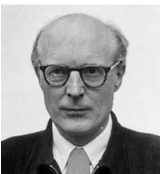
J.H.D. Jensen um 1956

1931 erhielt Bergius zusammen mit Carl Bosch den Nobelpreis für Chemie „für ihre Verdienste um die Entdeckung und Entwicklung der chemischen Hochdruckverfahren“. Die Nationalsozialisten bemühten sich um Kontakte zu Bergius, doch er blieb auf Distanz zum NS-Staat. Nach Verlust seines Privatvermögens lebte Bergius in Berlin. Nach dem Zweiten Weltkrieg erhielt er Aufträge zum Bau von Chemieanlagen in Spanien und Argentinien. Am 31. März 1949 verstarb Bergius in Buenos Aires.