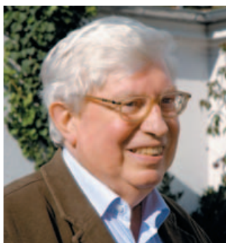
G. Ertl