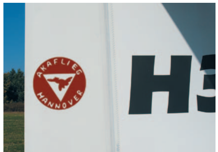
Den akademischen Verein Akaflieg gibt es seit den zwanziger Jahren des vergangenen Jahrhunderts.

Neben der Entwicklung, Konstruktion und Wartung von Segelfliegern steht natürlich das Fliegen an erster Stelle. Die Studierenden haben bei Akaflieg die Möglichkeit, den Segelflugschein zu machen. „Nach etwa 60 Starts kann der Schüler seinen ersten Alleinflug absolvieren“, erläutert