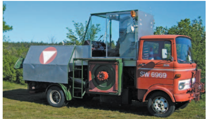
Mit Hilfe der etwa 300 PS-starken Winde sowie einem Stahlseil werden die Segelflieger in Bewegung gesetzt, über die Start- und Landebahn gezogen bis sie abheben und in der Luft schweben.