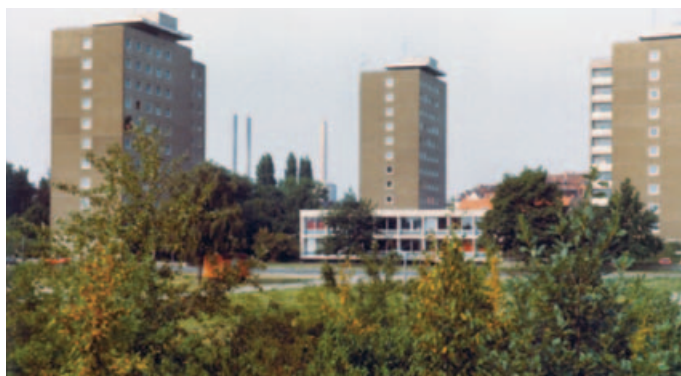
Im Studentenwohnheim Silo fanden in den Siebziger legendäre Diskoabende statt.

Höhepunkt war mittwochs und freitags die Disko im Studentenwohnheim Silo. „Mit Wallegewändern, bestickten Blusen und Fellmänteln standen wir in den langen Schlangen vor dem Eingang, weil dauernd wegen Überfüllung Einlassstopp war. Dort spielten sie alles, wonach man damals getanzt hat: Smokie, BeeGees, Saturday Night Fever“, erinnert sie sich.