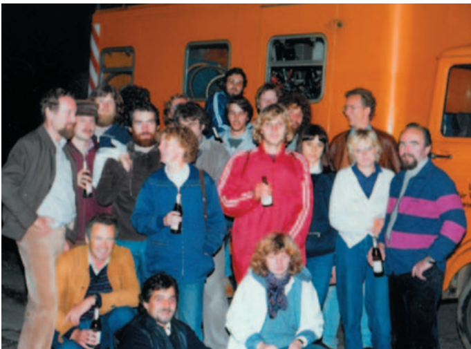
Teambildende Maßnahme: Mit dem Institutsbus ging es auch auf Ausflüge, inklusive Radtour und Fußballspiel.